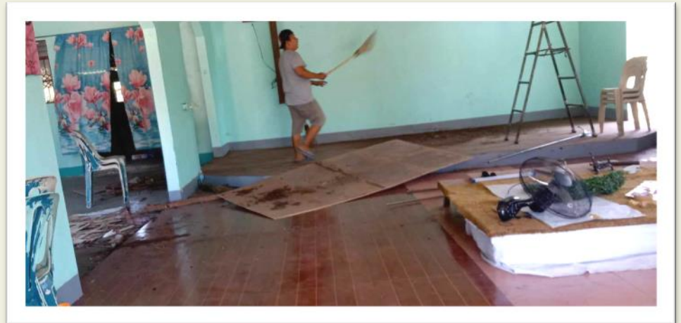
Maintenance work at Caring Congregational Christian Church, New Taugtog (Zambales Province)