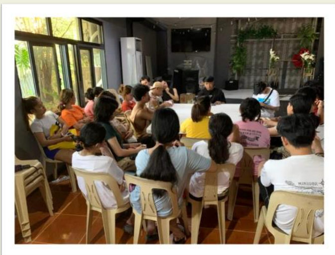
Leadership Training Promise Land Christian Church and School, Payatas (Metro Manila)