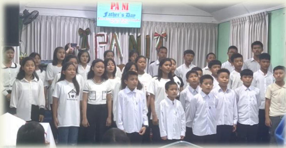
Shalom Children's Home, Yangon, Myanmar, Father's Day Service 2024 (24 March); musical item by the children.